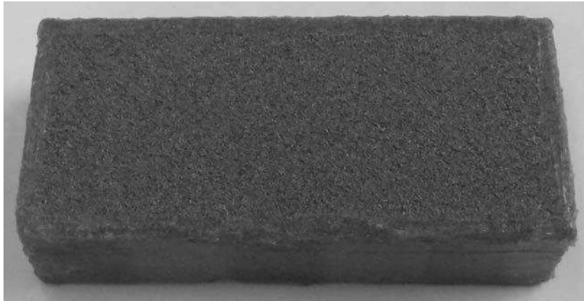
Figura 1. Campione di prova (Suber) dopo trattamento di sigillatura.

I 3 campioni sono stati condizionati fino a massa costante, dopodiché sono stati sigillati lungo la superficie perimetrale allo scopo di confinare l'assorbimento per capillarità alla sola sezione esposta all'acqua. Come richiesto dalla normativa 2-c, la sigillatura è stata applicata anche al bordo più esterno della superficie soggetta ad imbibizione per uno spessore di circa 5 mm, da cui risulta una superficie media esposta all'acqua di circa 239x 100 mm (Figura 1).